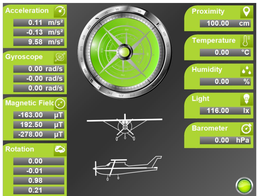
Screenshot: Darstellung der Sensordaten im CODESYS Development System (AndroidSensorApp.project)